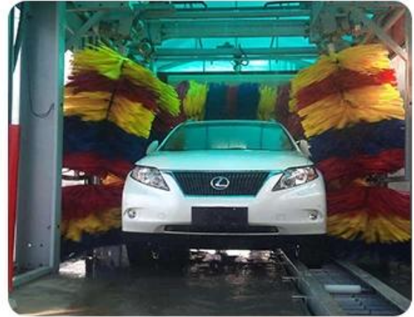
Car wash vehicle access control management