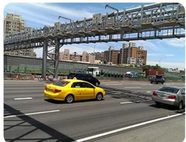
Vehicle toll collection management