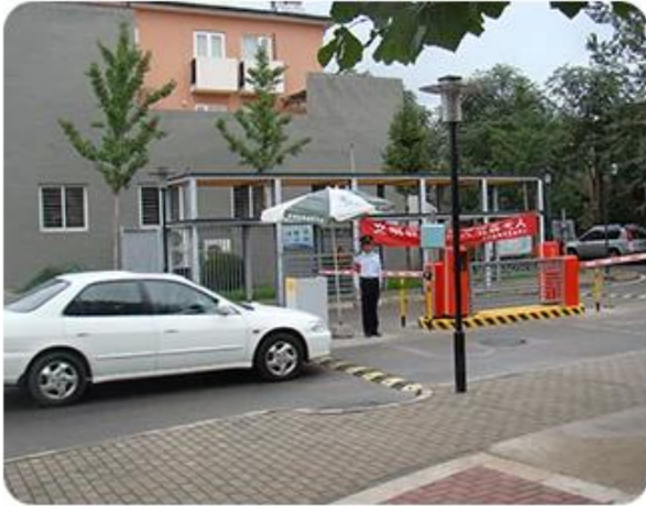
Parking Vehicle management