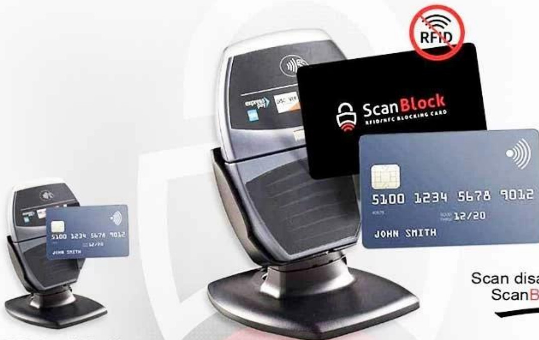
RFID Credit/Debit card scanned