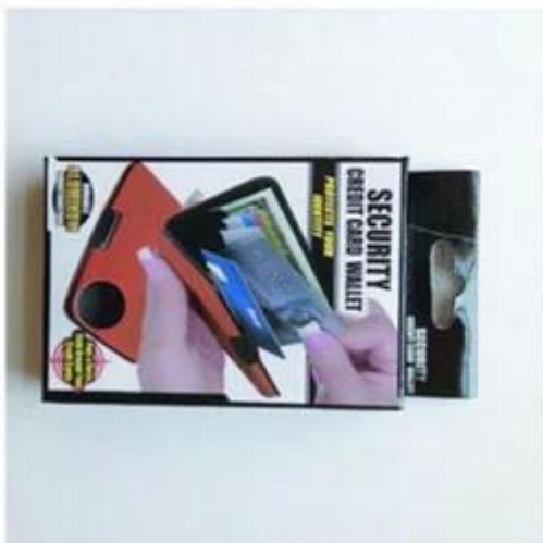
Custom printed box