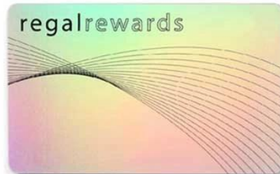
J. Laser Material