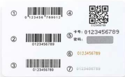
C. ① EAN 13 Barcode ② Code 128 ③ Code 39 ④ QR Code ⑤ Card NO. & PIN Code ⑥ Laser Code ⑦ Flat Code