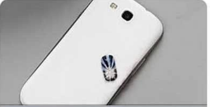
Step10 Approach NFC device,the led light up and blink.