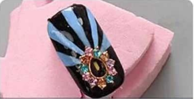
Step9 It's finish,it's easy.