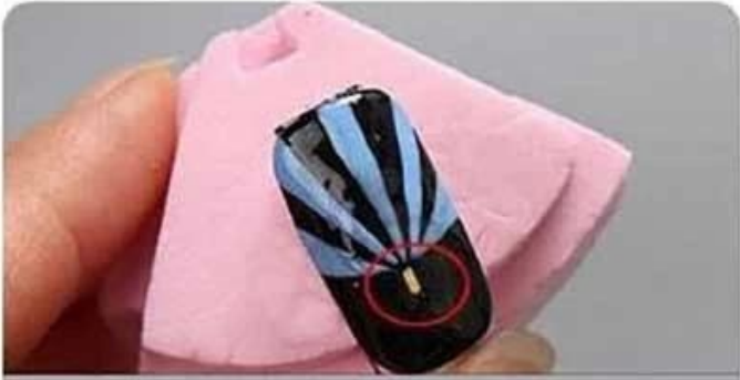
Step7 Semi- finish without decoration.