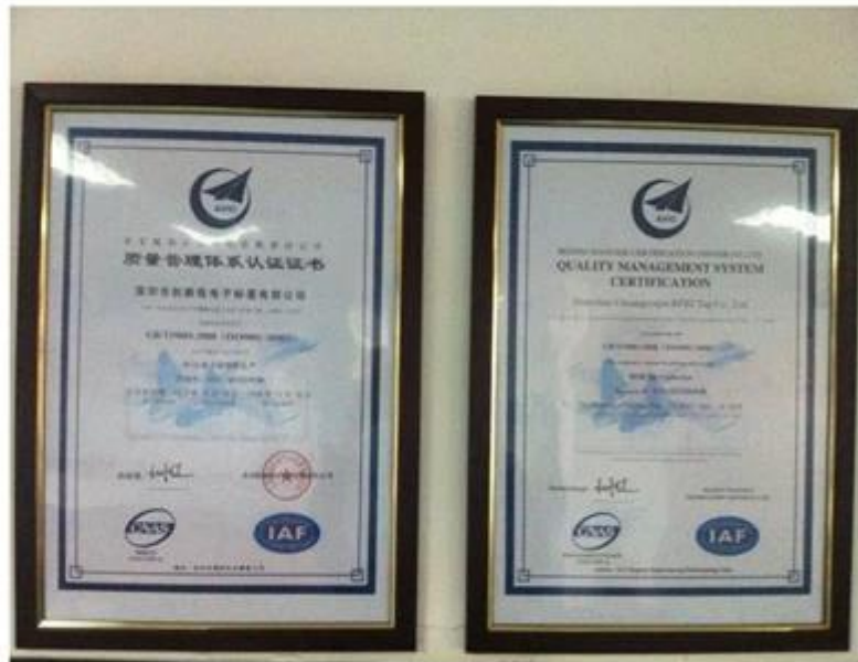
ISO9001 - 2008 Certificate