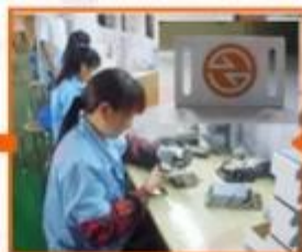
6. Testing & QC