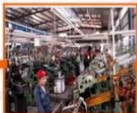
7. Fabric strip producing