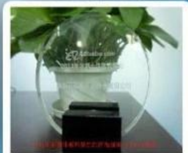
Outstanding and Honorable E-Businessman Award by Alibaba in 2011

Шэньчжэнь Chuangxinjia смарт-карт, ООО предлагает RFID браслетов в различных материалов, таких как силикон, ткани (ткани) и пластик, бумага и т.д. Мы можем настроить их, чтобы включить свой логотип и у нас есть ряд различных предложений по цвета. У нас есть RFID браслетов для точки продажи, кодовые номера, контроля доступа и безопасности, поддельные предупреждения, программы лояльности клиентов и водонепроницаемый средах. Наша цель - помочь браслет дизайн, надежно запечатаны, которые могут надежно хранить и передавать данные.