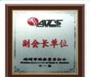
Vice President Company of Shenzhen Association of Trading in Services