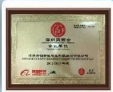
President Member Company of Shenzhen Chamber of E-Commerce