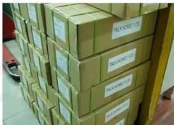
Outside Carton Package