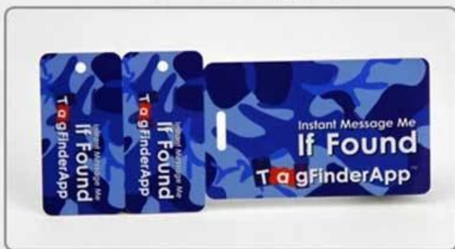
4. Comb card-style four