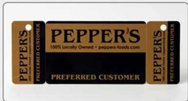
3. Comb card-style three