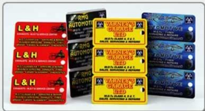
1. Comb card-style one