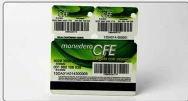
5. Comb card-style five