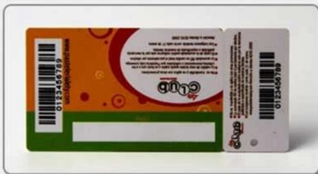
2. Comb card-style two