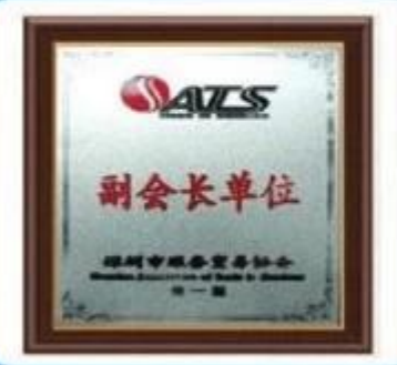
Vice President Company of Shenzhen Association of Trading in Services