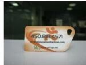
7. NFC PVC Tags