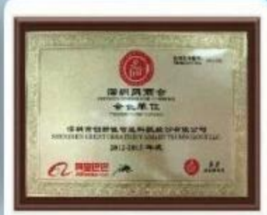
President Member Company of Shenzhen Chamber of E-Commerce