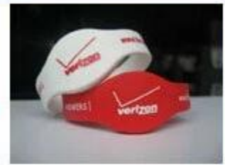
4.Silicone Wristbands (Full Sealed Type)