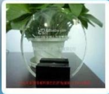
Outstanding and Honorable E- Businessman Award by Alibaba in 2011