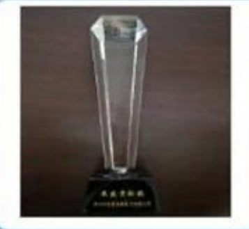
Outstanding and Honorable EBusinessman Award by Alibaba in 2010