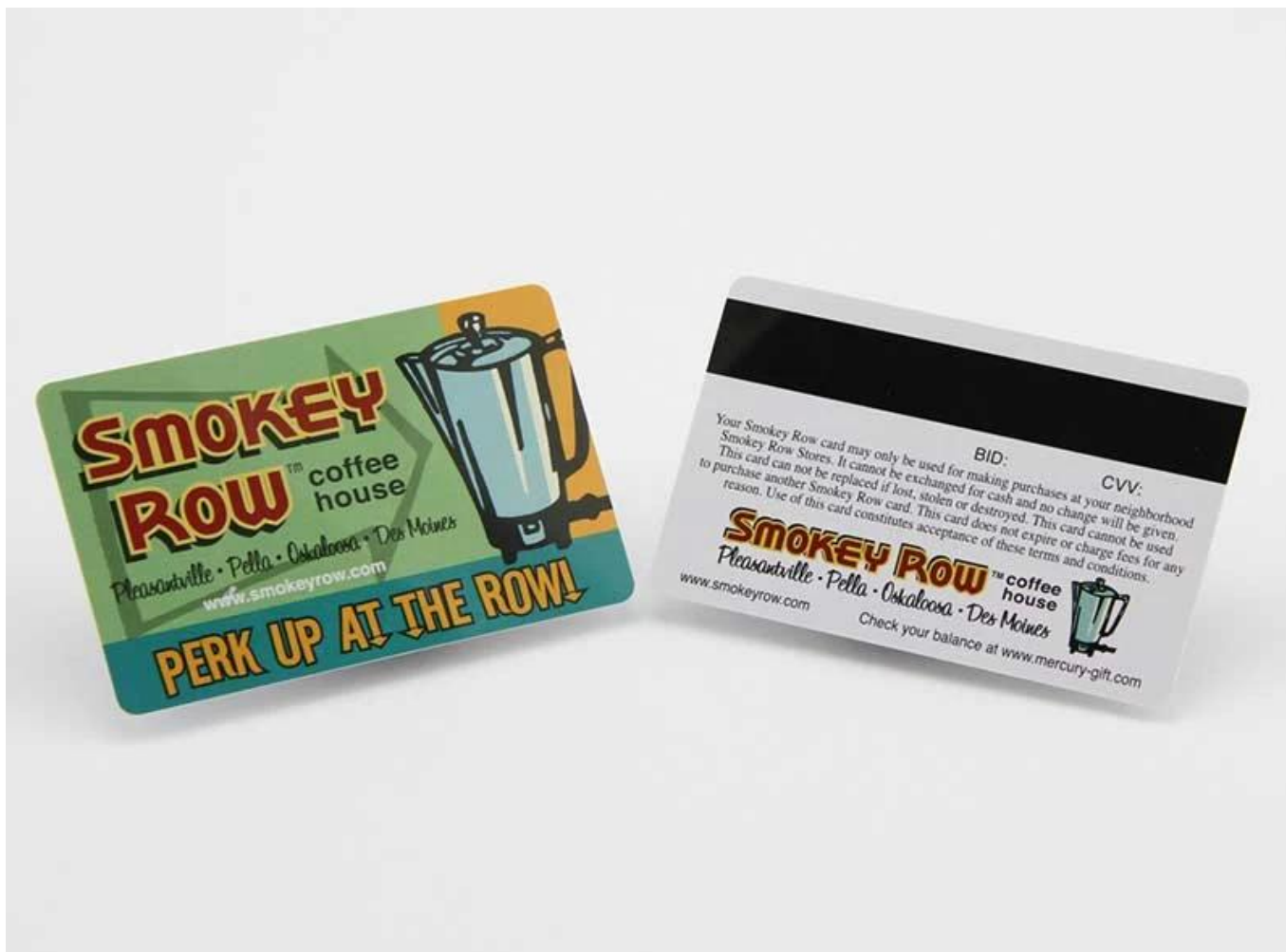
Imagem do Produto: