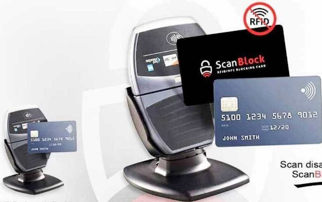
RFID Credit/Debit card scanned