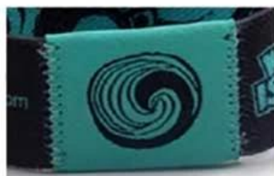
Z sides stitch