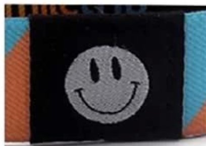
Panton woven logo