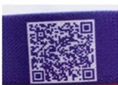
Unique QR code on band