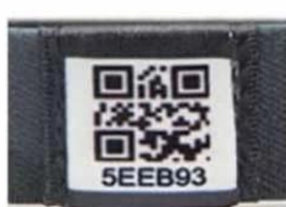
Unique QR code and number