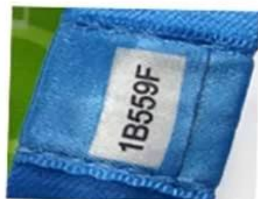
Unique serial number