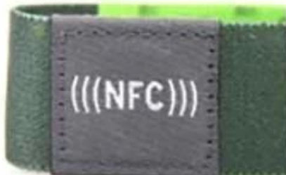
Four sides stitch