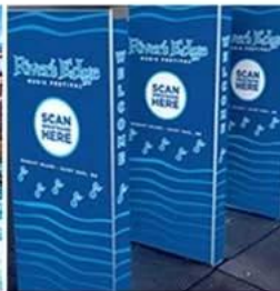
Exhibition & Conference