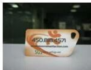
7. NFC PVC Tags