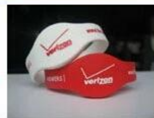
4. Silicone Wristbands (Full Sealed Type)