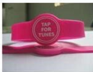
3. Silicone Wristbands (Adjustable Type)