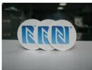
1. NFC Stickers