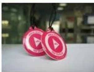
2. NFC Epoxy Tags