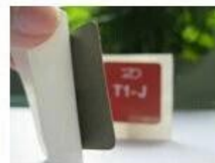
8. Anti-metal Stickers

Smart card Co. de Shenzhen Chuangxinjia, Ltd oferece pulseiras RFID em uma variedade de materiais, tais como o silicone, tecido (pano) e plástico, papel, etc. Nós podemos personalizá-los para incluir o seu logotipo e temos uma gama de várias ofertas de cor. Temos pulseiras RFID para ponto de venda, quartos de hotel sem chave, controle de acesso & segurança, prevenção de falsificação, programas de fidelidade do cliente e ambientes à prova de água.