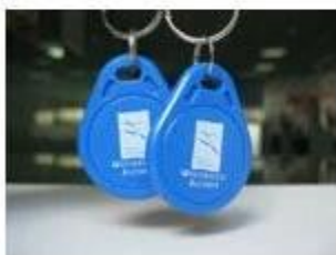
6. NFC Keyfobs