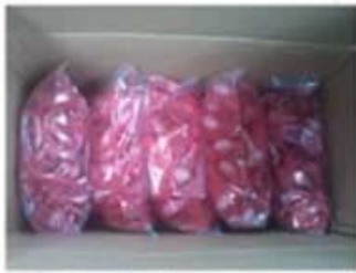
Package for Silicone Wristbands