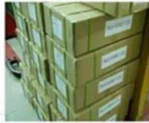
Outside Carton Package