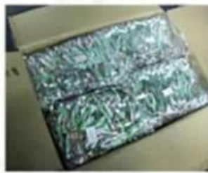
Package for Woven Wristbands