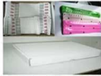
Package for Soft PVC/Paper Wristbands