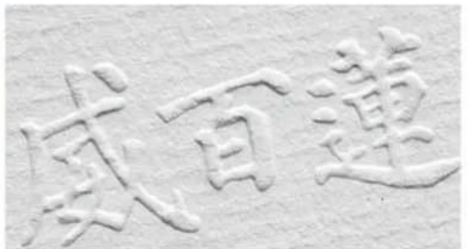
Concave and convex