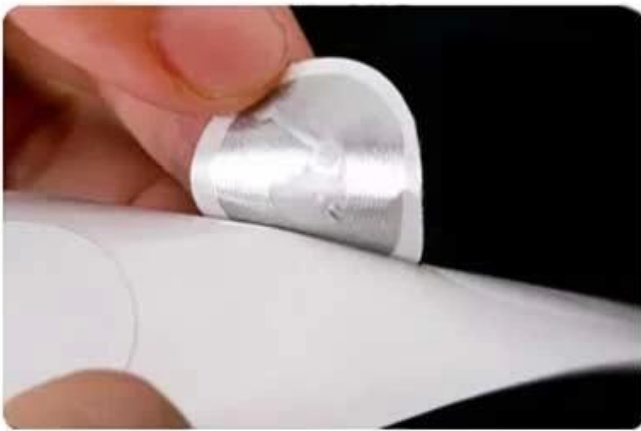
White label Coated paper + antenna+chip +adhesive layer