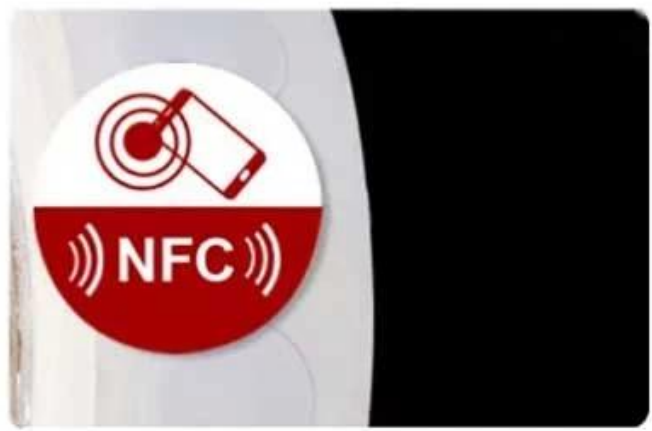
White label printing Coated paper + printing + antenna + chip + adhesive layer