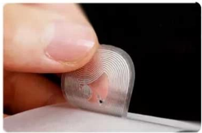
Wet label Antenna + Chip + Adhesive Layer