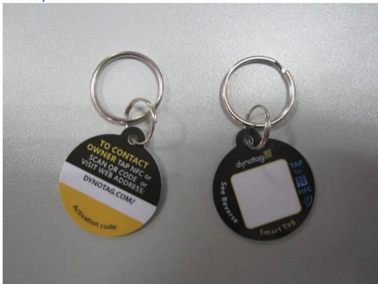
Foto do produto