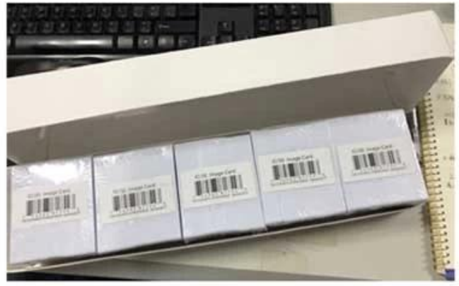
2. White Box