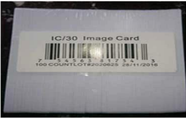
1. Hot Shrinkable film