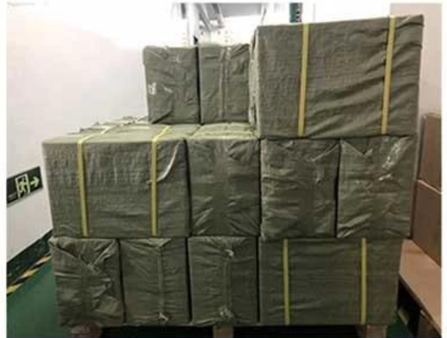
4. Customized Outer Package