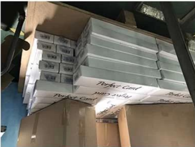
3. Outer Carton with High Quality