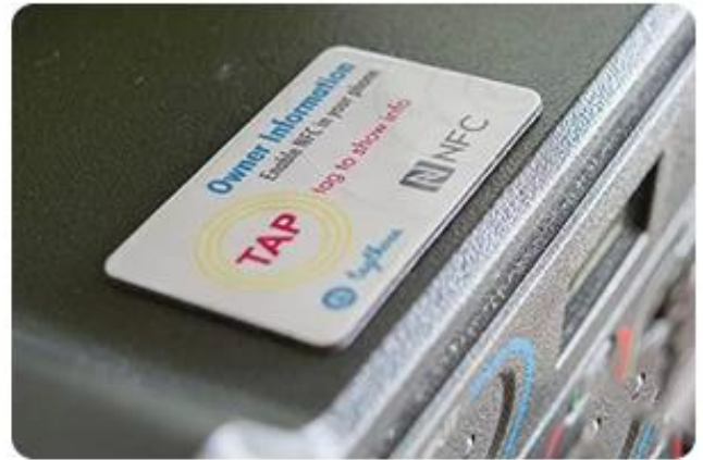
NFC business card