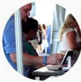
Payment for events