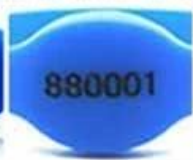
laser number with color