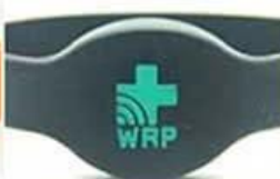
laser engraved with color