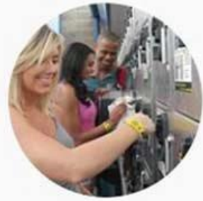
Used in SPA