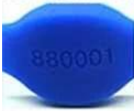
laser number no color