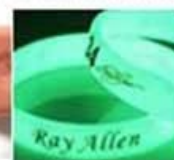
glow in dark