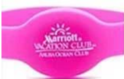
1 C silk screen printing