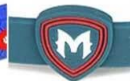
combination multi color