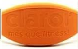
laser engraved no color