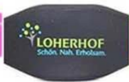
3 C silk screen printing