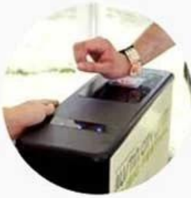
Secure access control