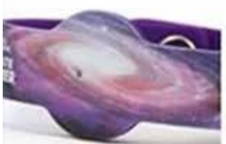
heat transfer printing