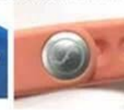
laser LOGO on lock