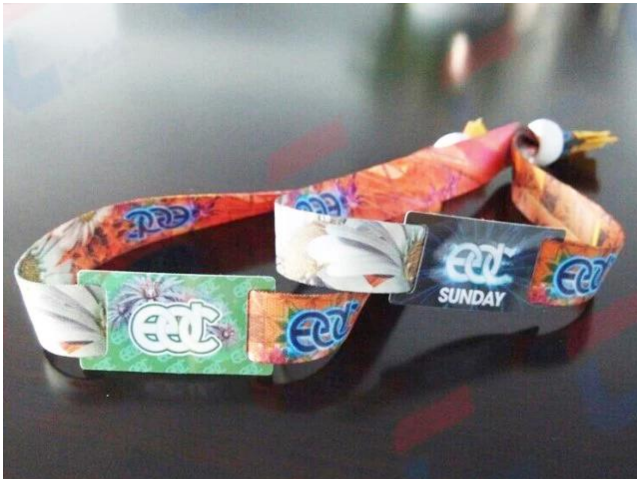
Processo de produção de pulseira de tecido tecido RFID