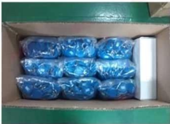
Inner Carton Package