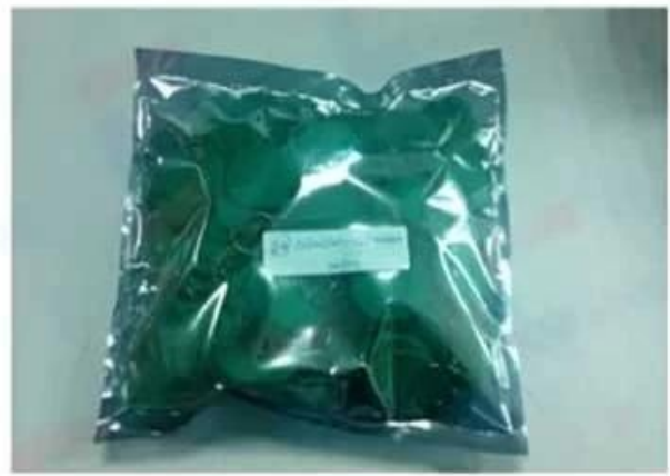
Antistatic bag (100 pcs/ bag)