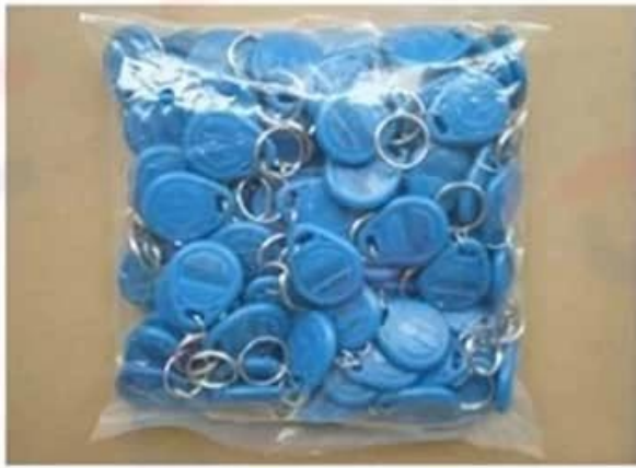
Default plastic bag (100 pcs/ bag)