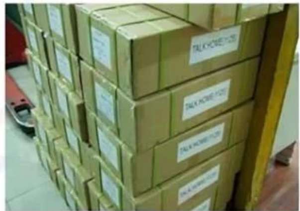
Outside Carton Package