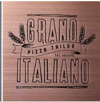
Etch with color infilling