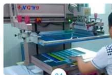
04 Silkscreen printing signature