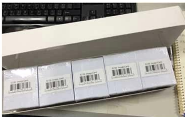
2. White Box