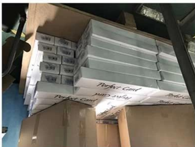
3. Outer Carton with High Quality