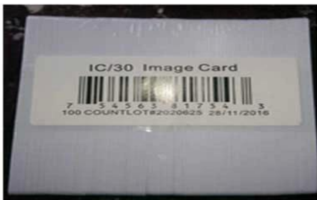
1. Hot Shrinkable film