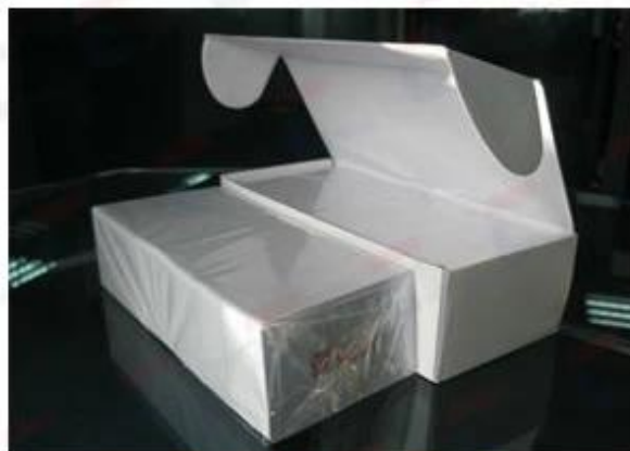
250/200 pcs Cards with Clear Paper