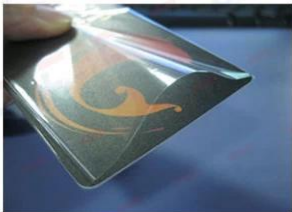
OPP Bag for Individual Card