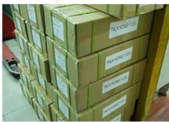
Outside Carton Package