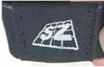
Two sides stitch