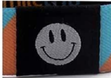
Panton woven logo