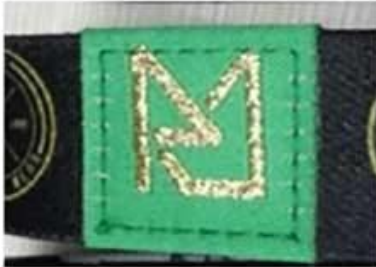
Gold woven logo