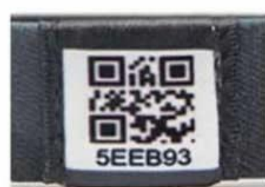
Unique QR code and number

Wilt u meer weten of wilt u aangepaste Elastic RFID polsbandje producten, neem dan gerust contact met ons op: info@nfctagfactory.com