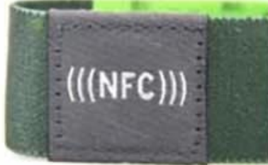
Four sides stitch