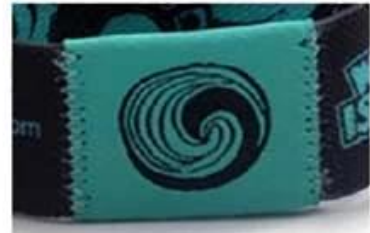
Z sides stitch