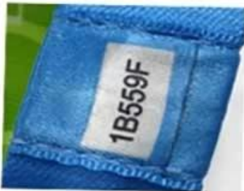
Unique serial number