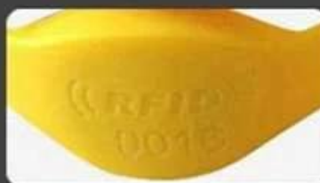
Laser UID number