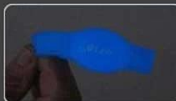
Glow in dark