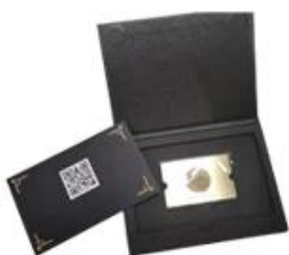
Customized Gift Card Holder