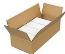
10-20 boxes per carton