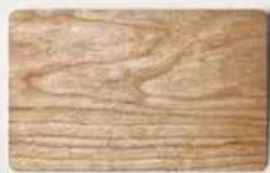
Red cherry wood