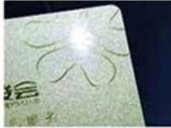
golden Hot Stamping