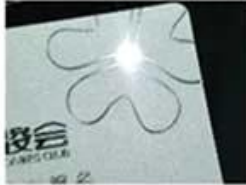
Silver Hot Stamping