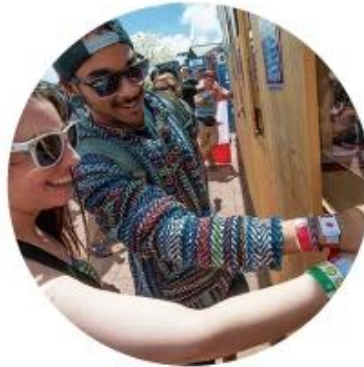
Social Media Sharing