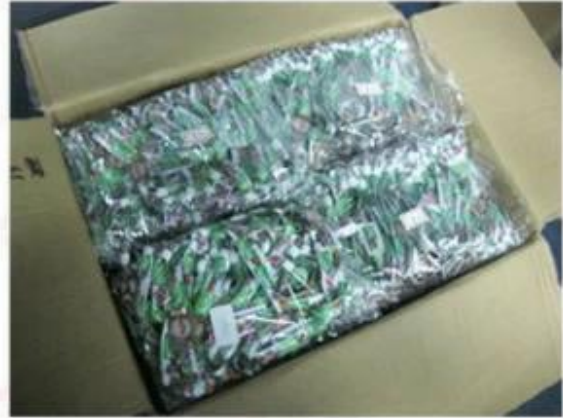
Package for Woven Wristbands