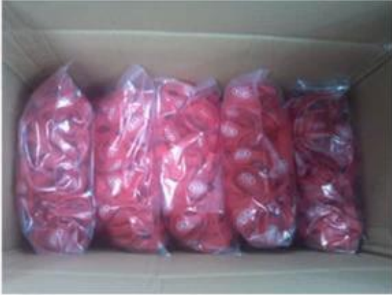
Package for Silicone Wristbands