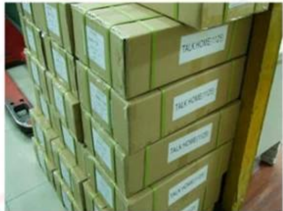
Outside Carton Package

Productieproces van Silicone RFID Polsband: