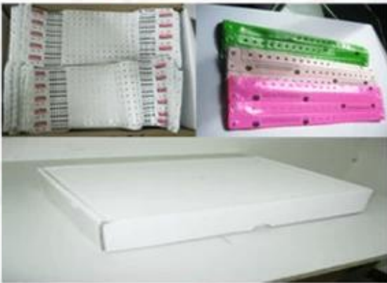
Package for Soft PVC/ Paper Wristbands