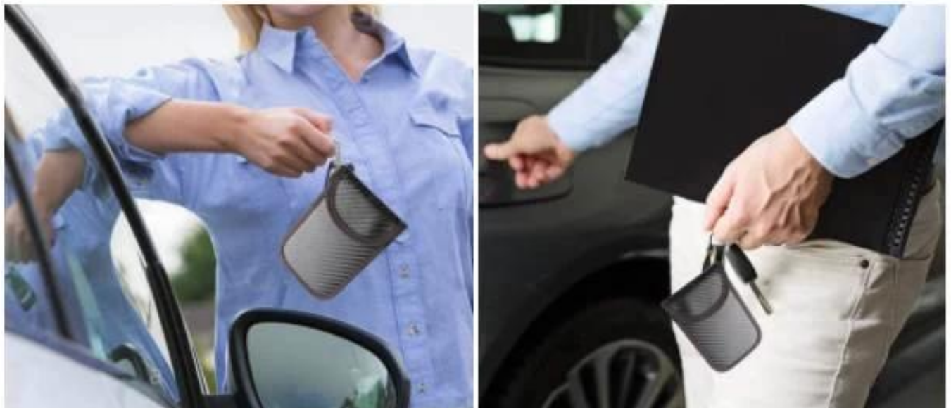
RFID-signaalblokkeerzak Gedetailleerde afbeelding: