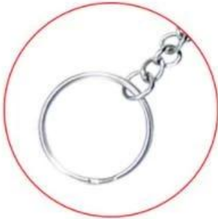
FIRMLY METAL KEYCHAIN