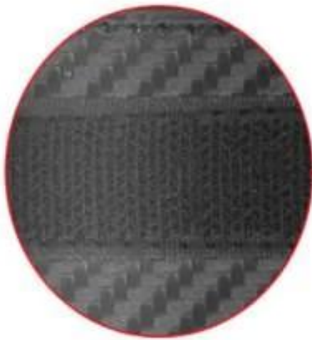
HIGH QUALITY VELCRO