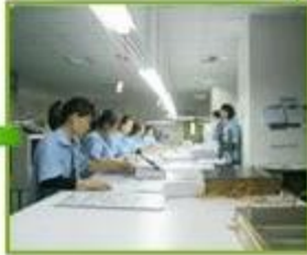
5.Printing sheets match up