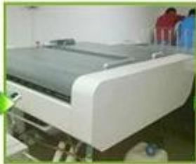
2.Film fabrication for printing