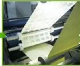
6.Lamination & formation