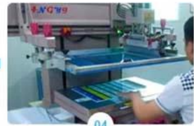
04 Silkscreen printing signature