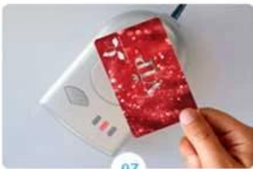
07 Pick-up cards