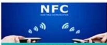
Data Exchange P2P