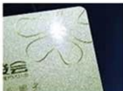
golden Hot Stamping