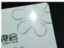
Silver Hot Stamping