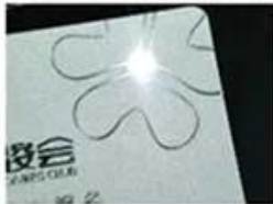
Silver Hot Stamping