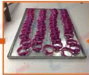
6. Silk printing