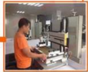
5.Film fabrication for printing