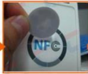
3. Inlay testing