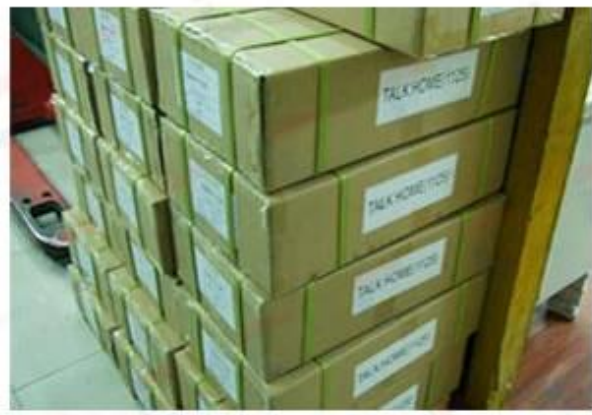
Outside Carton Package