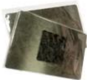
1pcs per poly bag