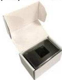
50pcs per white box