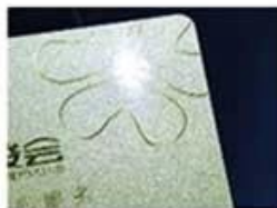
golden Hot Stamping