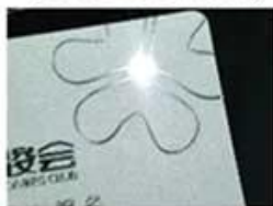
Silver Hot Stamping