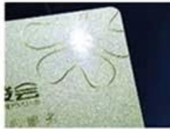
golden Hot Stamping