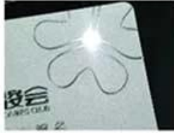
Silver Hot Stamping