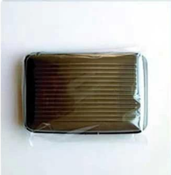
Normal opp bag