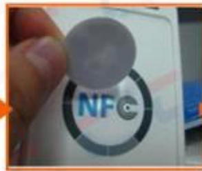
3. Inlay testing