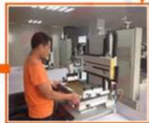
5.Film fabrication for printing