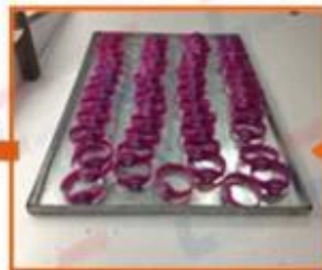
6. Silk printing