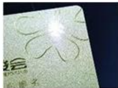
golden Hot Stamping