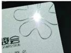
Silver Hot Stamping