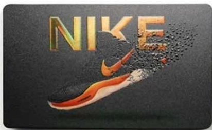
I. Embossed printing