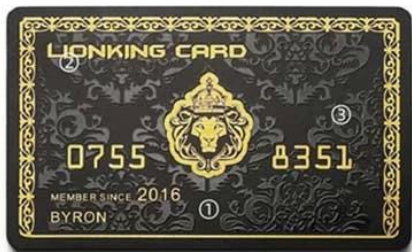
K. ① Matt finish ② Gold drawbench ③ UV vanish