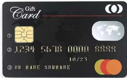
E. ① 4428 Chip ② Large Convex Code ③ Small Convex Code