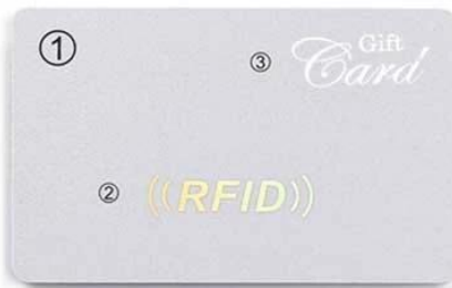
B. ① Silver Color ② Laser Silver Stamping ③ Silver hot Stamping