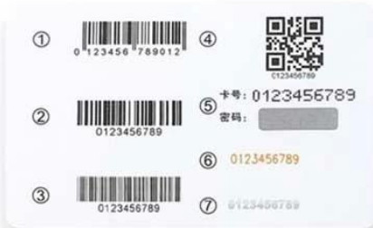
C. ① EAN 13 Barcode ② Code 128 ③ Code 39 ④ QR Code ⑤ Card NO. & PIN Code ⑥ Laser Code ⑦ Flat Code