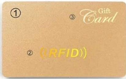
A. ① Gold Color ② Laser Gold Stamping ③ Gold hot Stamping