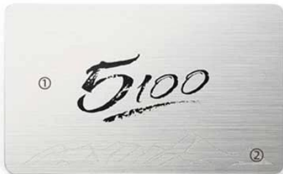
G. ① Silver drawbench ② Frosted UV