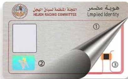
H. ① Pearlescent Color ② Anti-fake label ③ RFID Chip