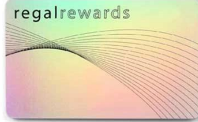
J. Laser Material