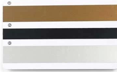
D. ① Gold Magnetic Stripe ② Black narrow Magnetic Stripe ③ Silver Magnetic Stripe