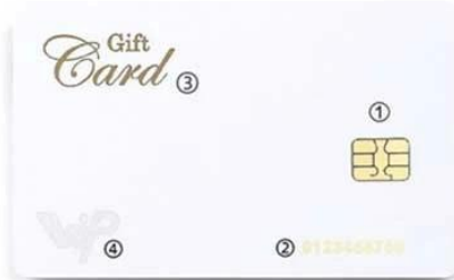
F. ① 4442 Chip ② Gold Flat Code ③ Gold Silk Screening ④ Silver Silk Screening