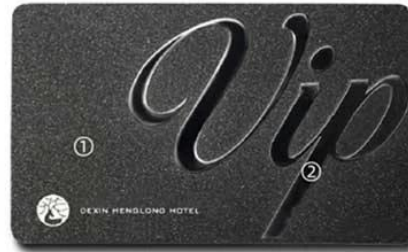
L. ① Frosted finish ② Metal Label