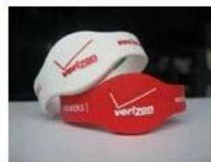
4. Silicone Wristbands (Full Sealed Type)