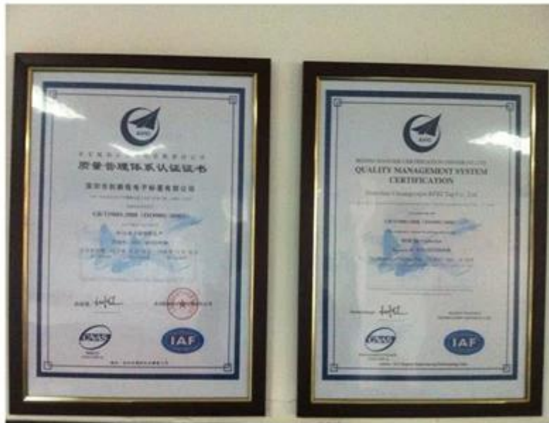
ISO9001 - 2008 Certificate