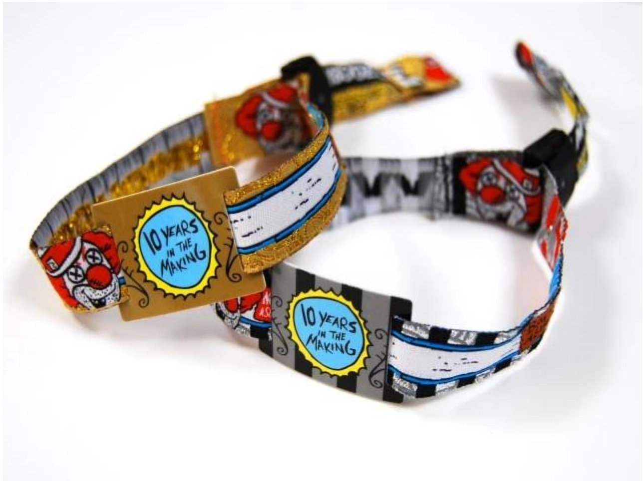
Processo di produzione del braccialetto tessuto del tessuto RFID